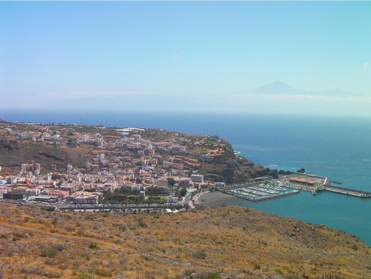
Rollen in der Atlantikwelle